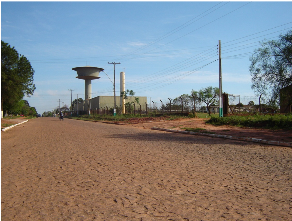
Centro de distribución de agua potable