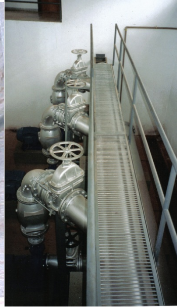
Estación de bombeo de agua residual (izq.), de agua potable (der.)