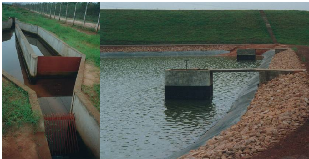
Estructura de desarenado (izq.), estructura de salida (der.)

La ex empresa estatal proveedora de agua Corposana recibió fondos del BID para el desarrollo de varios proyectos de saneamiento urbano y agua potable. El OBRASAN Consorcio ha sido contratado para las obras en la ciudad de Caaguazú de aproximadamente 35.000 habitantes.