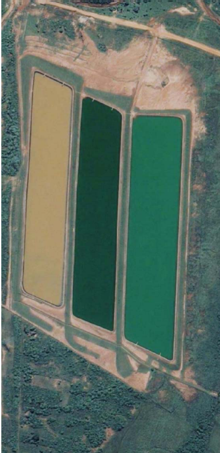
Lagunas de tratamiento, vista aérea